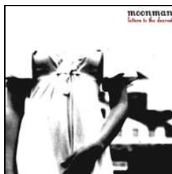
« Letters to the dearest » Greed Recordings 2006