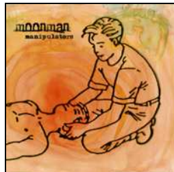
« Manipulators » Greed Recordings 2003